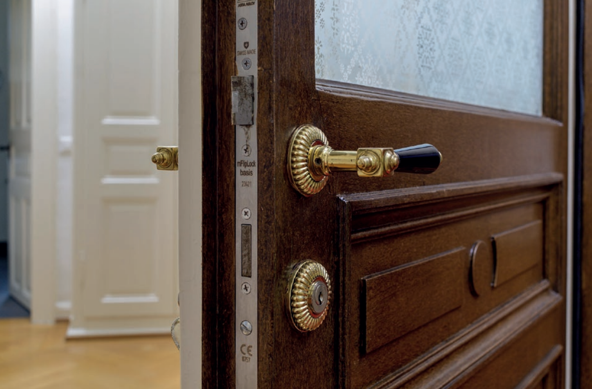
Villa Zürcher Hochschulquartier Historische Türe mit Brandschutz EI30 aufgerüstet und mit restaurier- tem Original-Drücker und -Schild